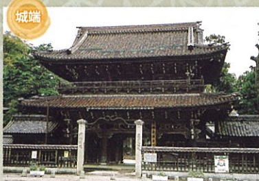
城端別院 善徳寺 蓮如上人の開基から530年余りの古刹。本尊は行基作と伝えられる阿弥陀如来像。宝物収蔵館では貴重な古文書や宝物が見学できます。