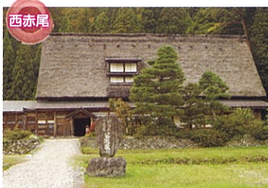
国指定重要文化財 岩瀬家 南砺市西赤尾にあり、約300年前に建てられた五箇山地域最大規模の合掌造り、総ケヤキ造りの準5階建て家屋です。