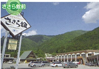
道の駅上平 ささら館 五箇山ならではの特産品・お土産を多数取り揃えています。また、岩魚料理をはじめ、山菜そばや五箇山豆腐など、絶品料理も気軽に味わえます。