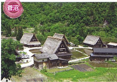
世界遺産 菅沼合掌造り集落 旧上平村のほぼ中央にある小さな集落。合掌造り家屋9棟をはじめ、土蔵や板倉などの伝統的な建物、雪持林や茅場などの山林をも含めた地域が史跡に指定されています。