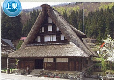
国指定重要文化財 村上家 南砺市上梨にあり、約400年前の建築当時の様式を伝える貴重な合掌造り家屋で、民族資料なども展示しています。