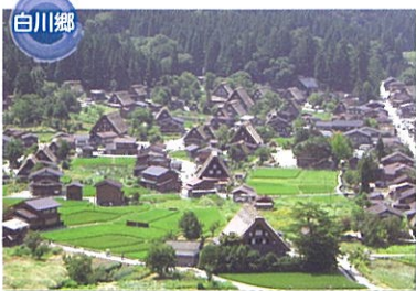
世界遺産 白川郷合掌造り集落 世界遺産に登録された3集落の中では最も大きな集落です。集落の全域に山麓の林の一部を含む約45.6haが重要伝統的建造物群保存地区として保存され、歴史的景観が維持されています。