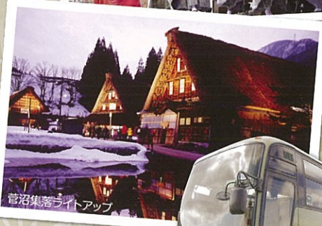
菅沼集落ライトアップ