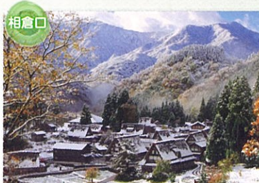
世界遺産 相倉合掌造り集落 今も20棟以上の合掌造り家屋が現存し、生活が営まれていて、集落と周りの環境が織りなす美しい風景を目の当たりにすることができます。季節ごとに行われるライトアップは必見!幻想的な空間に心奪われます。