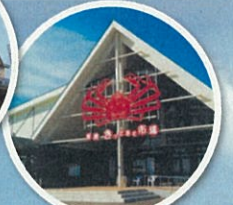
新湊きつとときと市場