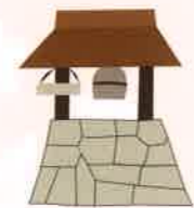
《除夜の鐘》瑞泉寺 大晦日の夜十一時から0時半頃まで、 どなたでもご自由に参加できます