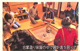
合掌造り家屋の中で囲炉裏を囲んで

「無駄な殺生はしない」、口にするものは全て「戴いた命」であることを忘れないと、常に自然への感謝を忘れず、自然体で生きるのが狩人の流儀。合掌家屋の中で狩猟肉を使った昼食とともに、五箇山の狩人からお話しを聞きます。