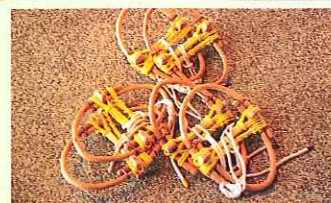
くろもじの木で作られた輪かんじき

「スノーシュー」ならぬ「かんじき」体験。ガイドと一緒に雪原を歩き、豪雪地帯に住む人々の知恵を学びます。合掌屋根に登ってプチ雪下ろし体験にも挑戦!「世界遺産合掌造り集落」の幻想的な冬の景色も見どころです。