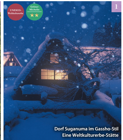
Dorf Suganuma im Gassho-Stil Eine Weltkulturerbe-Stätte

Das zur Weltkulturerbe-Stätte erklärte Dorf Ainokura im Gassho-Stil beherbergt auch heute noch eine relativ große Bevölkerung. Das Dorf bewahrt historische Gebäude, von denen einige vor fast 350 Jahren gebaut wurden und von denen einige sogar Übernachtungsmöglichkeiten bieten.