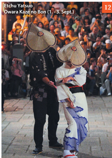
Etchu Yatsuo Owara Kaze no Bon (1. - 3. Sept.)