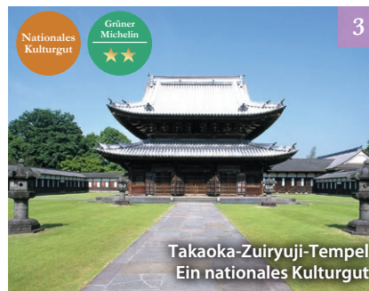
Takaoka-Zuiryuji-Tempel Ein nationales Kulturgut

Ein Tempel der buddhistischen Sekte Jodo Shinshu, der als repräsentativ für die Präfektur Toyama gilt. Die Haupthalle und die Empfangshalle sind als nationales Kulturgut ausgewiesen, und zehn weitere Gebäude sind als wichtige Kulturgüter eingestuft.