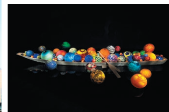
Dale Chihuly, Toyama Float Boat, 2015, H60x8917,5xT657,5 cm, Toyama Glaskunstmuseum