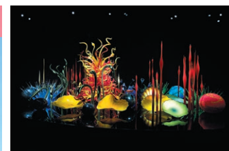
Dale Chihuly, Toyama Mille Fiori, 2015, H280x8940xT580 cm, Toyama Glaskunstmuseum