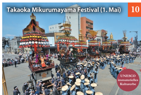
Takaoka Mikurumayama Festival (1. Mai)