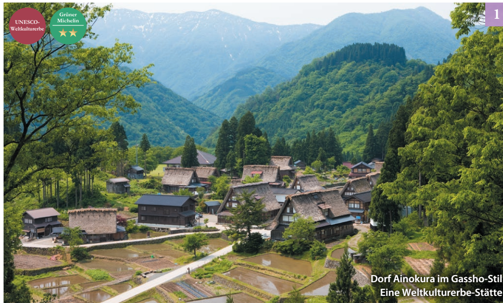
Dorf Ainokura im Gassho-Stil Eine Weltkulturerbe-Stätte

Überall in der Präfektur finden Besucher Architektur und Stadtbilder mit dem Charme vergangener Zeiten, darunter die Gegend um Gokayama mit gut erhaltenen historischen japanischen Landschaften sowie die Gebiete Takaoka und Inami, die als große Hersteller von traditionellem Handwerk florieren.