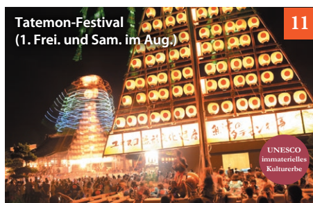
Tatemon-Festival (1. Frei. und Sam. im Aug.)