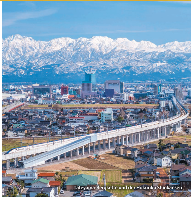
Tateyama-Bergkette und der Hokuriku Shinkansen

Tateyama-Kurobe Alpen-Route Herbstlaub in Kurobedaira (Ende Sep. - Mitte Okt.)