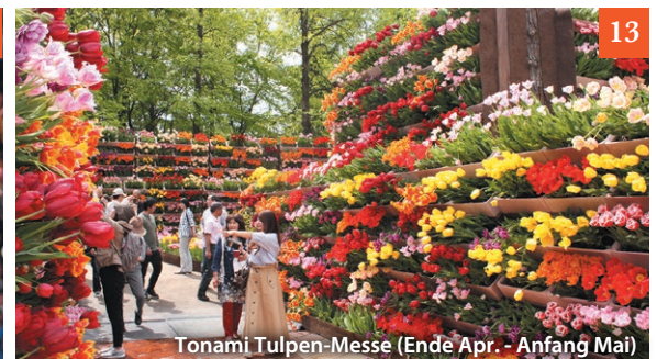
Tonami Tulpen-Messe (Ende Apr. - Anfang Mai)