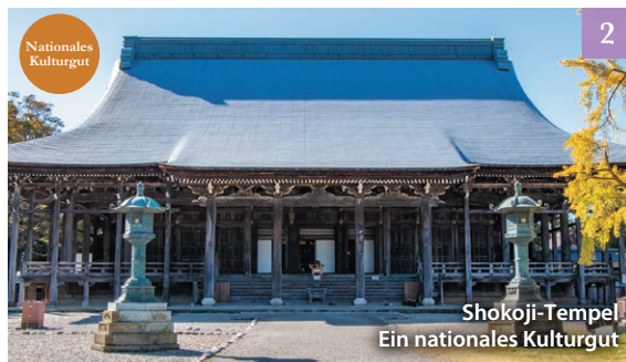
Shokoji-Tempel Ein nationales Kulturgut

Saisonale nächtliche Beleuchtungen umgeben den Bereich und schaffen einen außerweltlichen Eindruck.