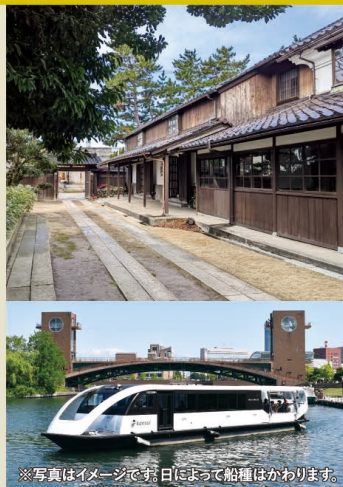
※写真はイメージです。日によって船種はかわります。

開催日 2026年 5/2(土)、5/9(土)、6/6(土) 参加費 / 小学生 5,000円 中学生以上 6,000円 最少催行人数…1人(最大20人) 出発決定…出発日から起算して10日前 ※高校生以下は保護者同伴