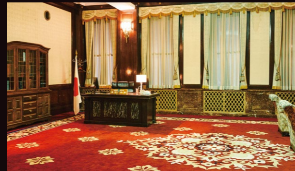
C 特別室 「内閣総理大臣執務室」として登場。ドアをぶち破り、室内で相葉と蓮司が格闘するシーン。撮影前から2週間ほど貸切り、扉や窓ガラスをアクション用に特別に設えて撮影。