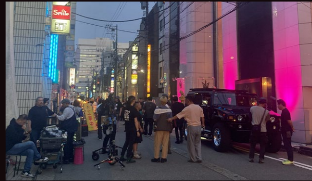
歌舞伎町最大のホストクラブ「ドリーミング」の外観。蓮司とキムが店前で警備員たちを襲うシーン。