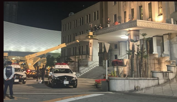
D 屋根 正面中央にある車寄せの屋根の上で、相葉と蓮司のアクションシーンを撮影。重機を使用したワイヤーアクションでの演出は迫力満点!