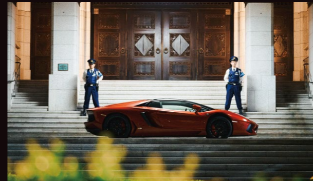
A 正面玄関 相葉とチェ・シウが警備警察を倒して中に侵入するシーン。車寄せに真っ赤なランボルギーニが乗り付けられる光景はとにかく貴重!