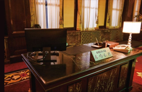
2 富山エクセルホテル東急