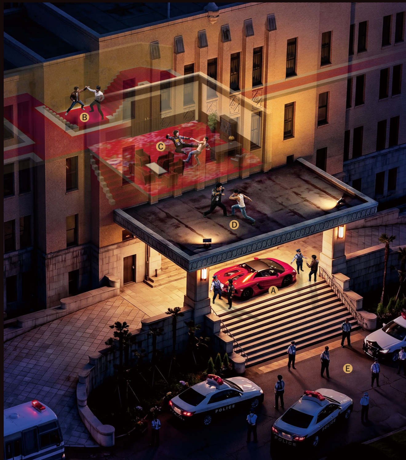
1 富山県庁 「首相官邸」としてクライマックスシーンに登場。平日の閉庁後の県庁前および庁舎内で、夜から翌朝までのナイト撮影が5日間行われた。