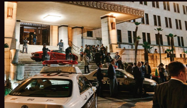
E 正面玄関前 多数のバトカーとともに大勢の警官が集まり、事件が収束するシーン。警官やマスコミのエキストラとして、大勢の方々にご協力いただいた。