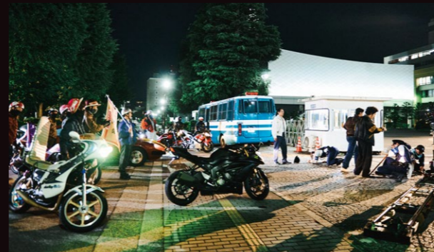
正門前 官邸敷地内に入っていき蓮司とキムを追う相葉たちがゲートで止められるシーン。正門やゲートを飾り、県庁前の道路を一時的に規制して撮影。

映画『TOKYO BURST - 犯罪都市-』の富山ロケは、2025年6月6日～17日に全てナイト撮影で行われました。東京新宿・歌舞伎町を想定して、富山市中心部で交通規制のもと迫力のあるアクションシーンが各所で撮影されました。