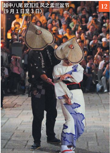
越中八尾 欧瓦拉 风之孟兰盆节 (9月1日至3日)