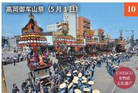
高冈御车山祭 (5月1日)