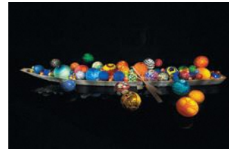
Dale Chihuly, Toyama Float Boat, 2015, H60xW917.5xD657.5cm, Toyama Glass Art Museum