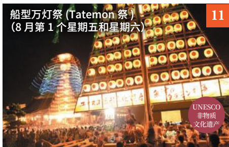
船型万灯祭 (Tatemon 祭) (8月第1个星期五和星期六)