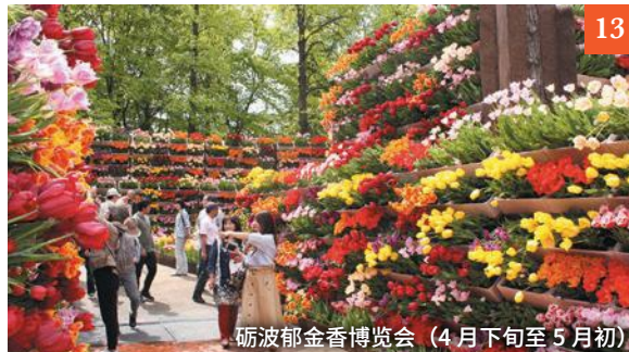
砺波郁金香博览会 (4月下旬至5月初)