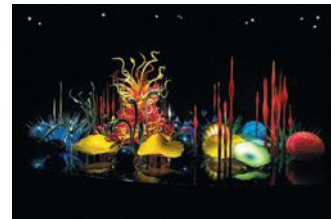
Dale Chihuly, Toyama Mille Fiori, 2015, H280xW940xD580cm, Toyama Glass Art Museum