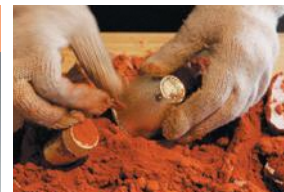
다카오카 청동 제품

다카오카 청동 제품을 만드는 법을 배워 찻잔이나 작은 접시 등의 주석 제품을 만드는 체험도 가능하다.