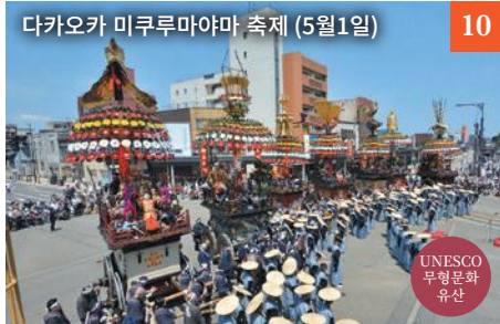
다카오카 미쿠루마야마 축제 (5월1일)