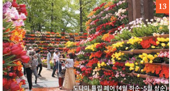
도나미 튤립 페어 (4월 하순~5월 상순)