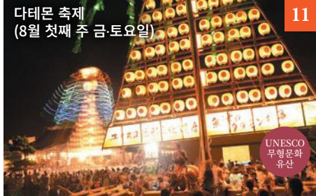
다테와 축제 (8월 첫째 주 금·토요일)