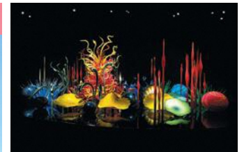
Dale Chihuly, Toyama Mille Fiori, 2015, H280xW940xD580cm, Toyama Glass Art Museum