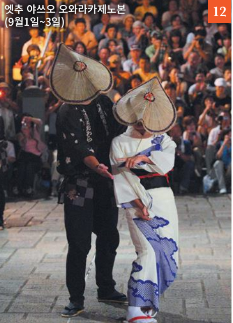
옛추 야쓰오 오와라카제노본 (9월1일~3일)