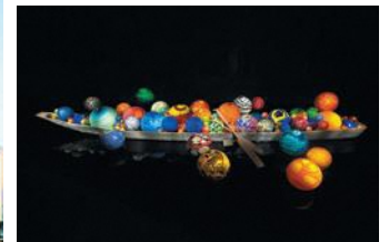
Dale Chihuly, Toyama Float Boat, 2015, H60xW917.5xD657.5cm, Toyama Glass Art Museum