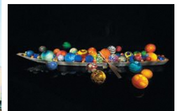
Dale Chihuly, Toyama Float Boat, 2015, H60xW917.5xD657.5cm, Toyama Glass Art Museum