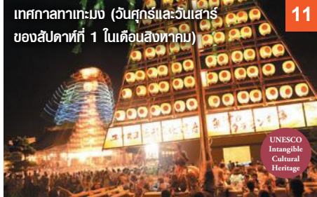
เทศกาลทากาเมง (วันศุกร์และวันเสาร์ของสัปดาห์ที่ 1 ในเดือนสิงหาคม)