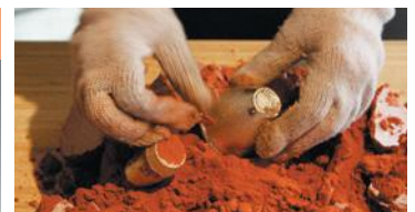
เครื่องทองแดงทาคาคาโอกะ

สามารถเรียนรู้วิธีการผลิตเครื่องทองแดงทาคาคาโอกะและสัมผัสประสบการณ์ที่ผลิตกันที่ตึกบุกเซนกยูโนมิ (ถ้วยสาเก) งานในเล็กๆ และอื่นๆ