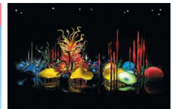
Dale Chihuly, Toyama Mille Fiori, 2015, H280xW940xD580cm, Toyama Glass Art Museum