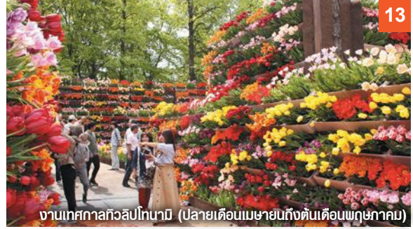
งานเทศกาลทิวลิปโทนาบิ (ปลายเดือนเมษายนถึงต้นเดือนพฤษภาคม)