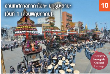
งานเทศกาลทาคาโอกะ มิคุรุเมะยามะ (วันที่ 1 เดือนพฤษภาคม)