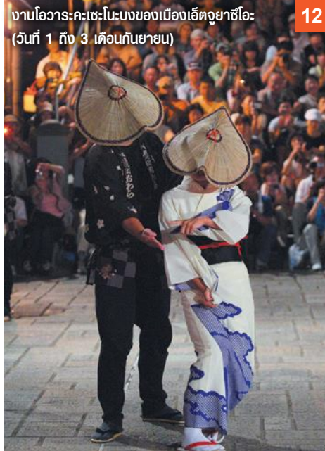
งานโอวาระ-คะเซะ-โนะบงของเมืองเอ็ตซุยยาชิโอะ (วันที่ 1 ถึง 3 เดือนกันยายน)