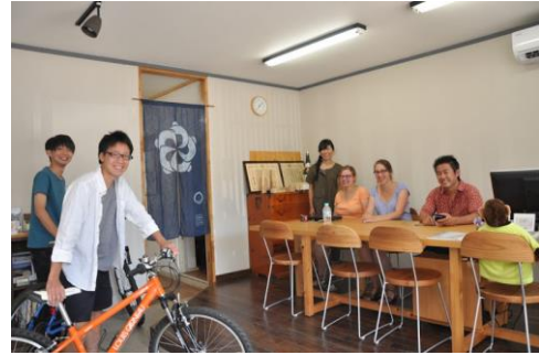
(株美ら地球の事務所の様子)